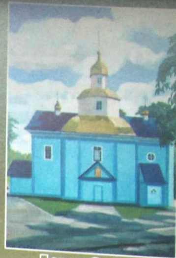
Петро Собко "Стара церква"