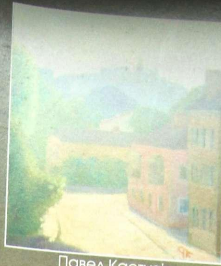
Павел Кастусік "Рівне. Ранок"

РІВНЕ - ОСТРОГ, 28 липня - 14 серпня 2008 р.